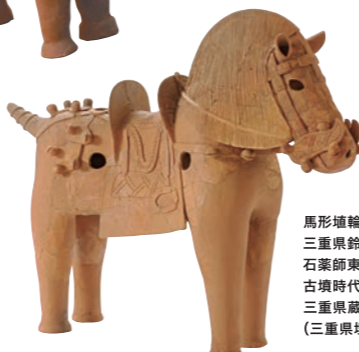
馬形埴輪 三重県鈴鹿市 石薬師東古墳群63号墳出土 古墳時代・5世紀 三重県蔵 (三重県埋蔵文化センター保管)