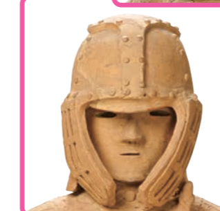
重要文化財 埴輪 挂甲の武人(部分) 群馬県伊勢崎市安塚町出土 古墳時代・6世紀 千葉・国立歴史民俗博物館蔵