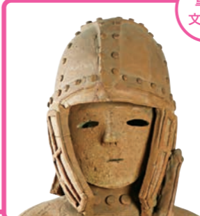
重要文化財 埴輪 挂甲の武人(部分) 群馬県太田市成塚町出土 古墳時代・6世紀 群馬(公財)相模古陶器蔵