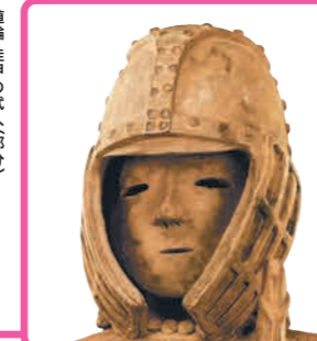
重要文化財 埴輪 挂甲の武人(部分) 群馬県太田市出土 古墳時代・6世紀 アメリカシアトル美術館蔵