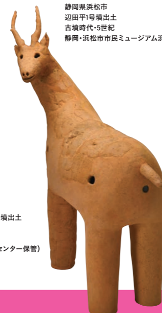
鹿形埴輪 静岡県浜松市 辺田平1号墳出土 古墳時代・5世紀 静岡・浜松市市民ミュージアム浜北蔵