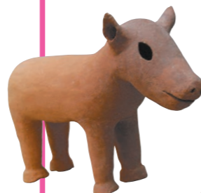
子馬形埴輪 大阪府四條畷市 忍ヶ丘駅前遺跡出土 古墳時代・6世紀 大阪・四條畷市教育委員会蔵 (四條畷市立歴史民俗資料館保管)

古墳からは、馬、鹿、鳥、犬、猪など、実にさまざまな動物の埴輪が発見されています。また、同じ鳥でも鶏、鷹、白鳥などが作られました。