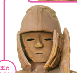
重要文化財 埴輪 挂甲の武人(部分) 群馬県太田市世良田町出土 古墳時代・6世紀 奈良・天理大学附属天理参考館蔵