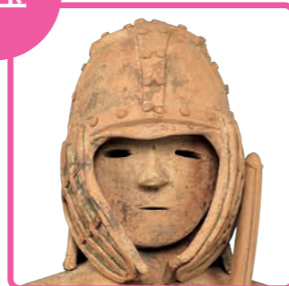
国宝 埴輪 挂甲の武人(部分) 群馬県太田市飯塚町出土 古墳時代・6世紀 東京国立博物館蔵