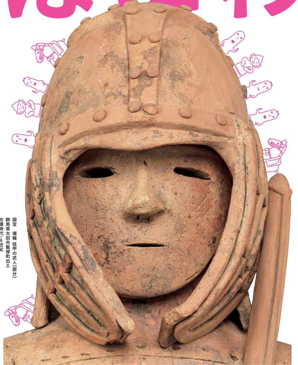
国宝 挂甲の武人 群馬県太田市飯塚町出土 古墳時代・6世紀 東京国立博物館蔵