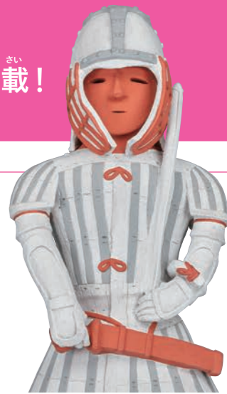
埴輪 挂甲の武人(彩色復元部分) 原品：群馬県太田市飯塚町出土 古墳時代・6世紀 東京国立博物館蔵 制作：文化財活用センター